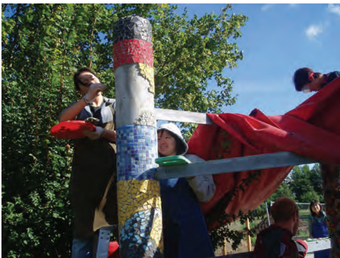
Jugendbegegnung 2006 in Drispfenstedt - Anlage und Gestaltung eines Baumpfades mit zentraler Skulptur am Ortsausgang nach Bavenstedt