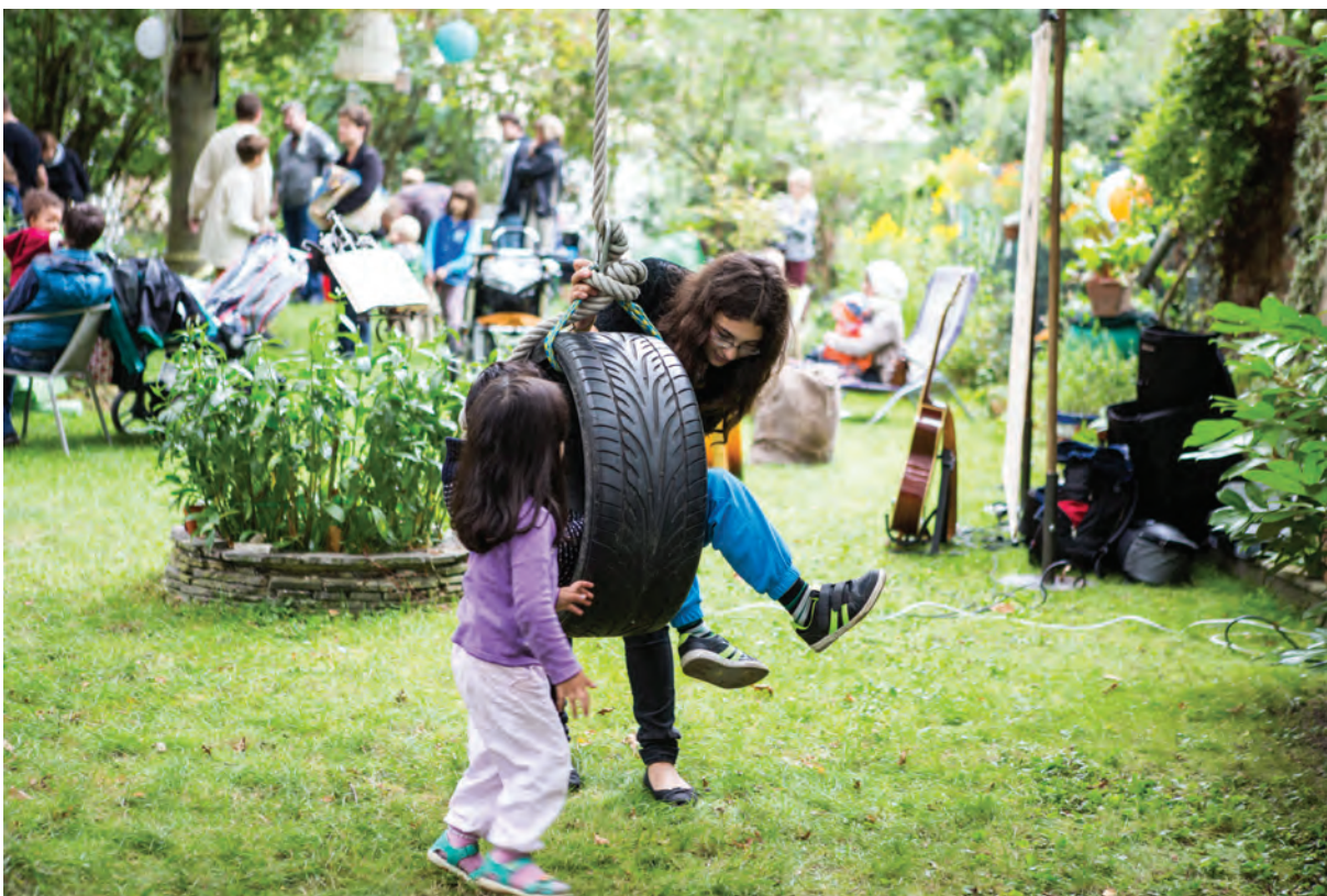
Hinten im Hof stellt auch im Jubiläumsjahr der Stadt Hildesheim ein Programm für die ganze Familie zusammen.

1. Organisationstreffen am 6. Mai im Treffer in der Peiner Straße 6